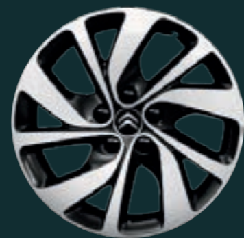
Original Citroen 17"-FELGE CURVE (optional)

Ihren persönlichen CAMPSTER gibt es in ganz verschiedenen Ausstattungsvarianten. Von der Wagenfarbe über die Innenausstattung, Motorversion, bis hin zu unterschiedlichen Sicherheitspaketen.