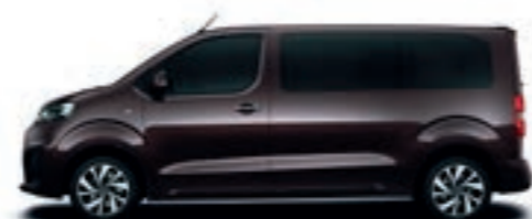
Rich Oak-Braun Metallic